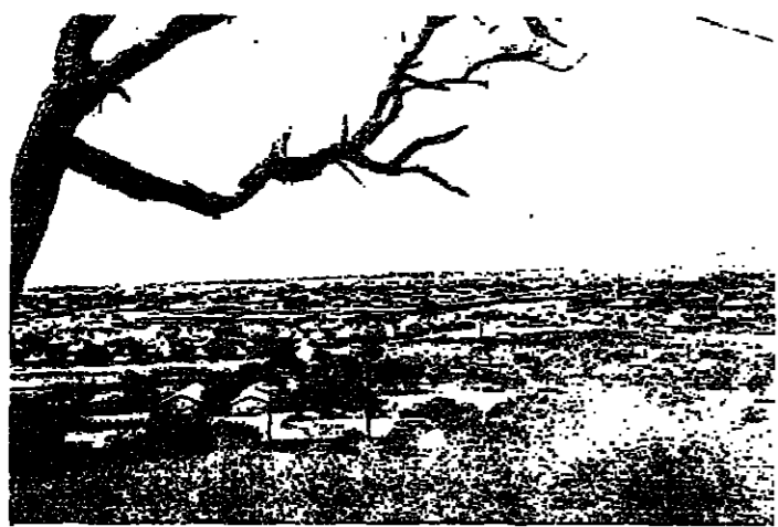
قريه في جنوب السودان

المصرية للاستثمار وينظر ان يتنهي العمل في تنفيذ المشروع في نهاية العام المقبل ١٩٧٨.